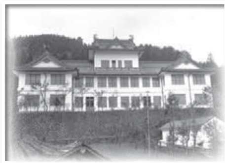
増設前の旧庁舎(大正初期)