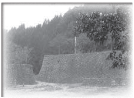
旧庁舎建設前の石垣(大正初期)