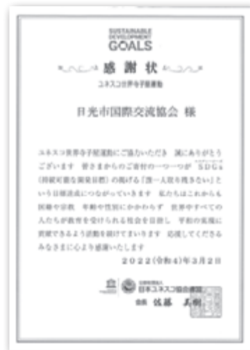
日本ユネスコ協会連盟からの感謝状