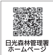
日光森林管理署ホームページ

野鳥観察と木工工作教室参加者 小倉山野鳥の森で、たくさん野鳥を観察し、子どもから年配の方まで楽しむことができます。 日 ：5月29日(日)午前9時～午後2時30分 所 ：日光霧降スケートセンター第2駐車場 料 ：300円(保険料) ※中学生以下無料 時 ：昼食、飲み物、雨具、山を歩ける靴 ※双眼鏡は貸し出しあり 申 ： 5月23日(月)午後5時までに問合先へ電話 ※詳しくはホームページをご確認ください 日 ：日光森林管理署 ☎(22)1069