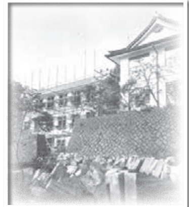
増築中の様子(大正中頃)