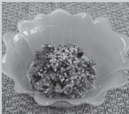
ツルナのごまマヨ和え

ツルナは、鮮やかな濃い緑色の茎がつる状に地面を這って伸びることから、蔓菜(つるな)と呼ばれています。