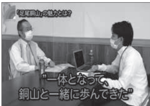
制作した動画の1シーン 足尾銅山の魅力についてインタビューしました