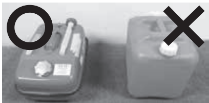
灯油缶でのガソリン保管は厳禁です