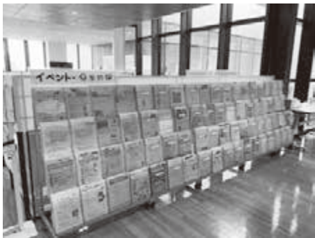
イベント・助成金・団体情報