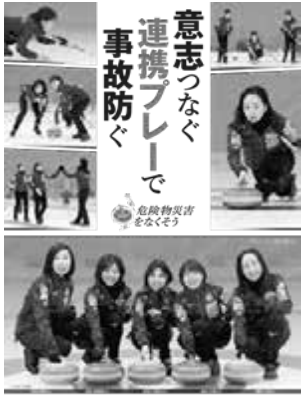
消防庁、警視庁、消防村、全国消防長会、一般財団法人全国危険物安全協会