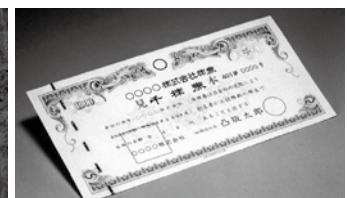
有価証券など 121億5,207万円