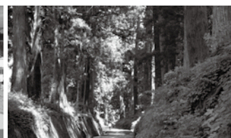
立木 日光街道杉並木の杉10本