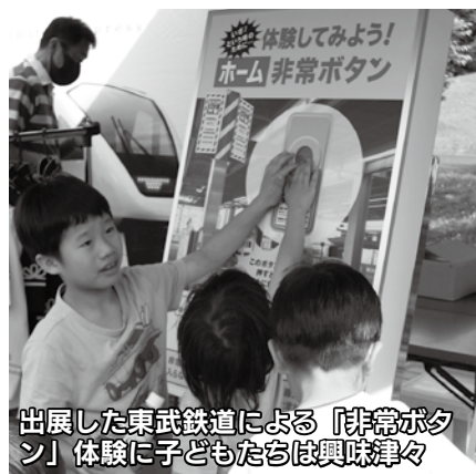
出展した東武鉄道による「非常ボタン」体験に子どもたちは興味津々

隣接3地域間での周遊を目指して日光青年会議所が企画したもので、来場者は会津や上州(群馬県)の地酒やグルメなどの「うまいもん」を楽しみました。