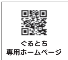
ぐる」とち 専用ホームページ