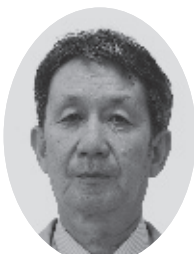
副議長 さいとう のりお 斎藤 紀雄氏