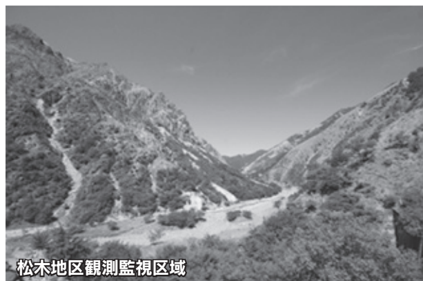
松木地区観測監視区域