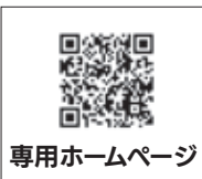
専用ホームページ