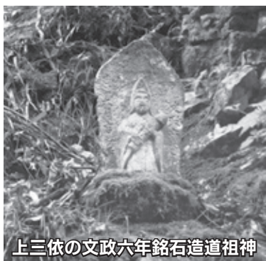
上三依の文政六年銘石造道祖神