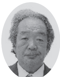
議長 あかばね うしいち 赤羽 忍一氏