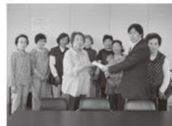
文・写真：人権・男女共同参画課

【熊本地震災害へ義援金】6/1 市地域婦人連絡協議会は、市社会福 祉協議会を通して日本赤十字社へ熊本 地震災害義援金を贈呈しました。日頃 から赤十字奉仕団としてさまざまな活 動を行っている同会は、被災した方々 の支援のため、会員から義援金を募り、 久保会長が 代表して社 会福祉事務 局長へ手渡 しました。 被災地の 1日も早い 復興を祈っ ています。