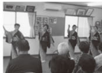
文・写真：森友若杉町自治会

【森友若杉町文化祭】5/27 6/12 今市 公民館の利用促進を目的に始めた文 化祭が早くも6回目を迎えました。 大正琴や日本舞踊、フラダンスの披 露の他、絵画や書、写真、版画、手芸、 アートフラワー、日光彫の展示など自 治会員の活動の成果を発表しました。 公民館に は、家族連 れなどたく さんの来場 者が訪れ、 大変にぎや かな文化祭 になりました。