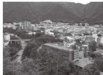
文・写真：藤原観光課

【鬼怒橋岩展望台が復旧】6/16 藤原 平成24年5月に「橋岩」周辺の斜面 で発生した大規模な崩落の影響で、鬼 怒橋岩大吊橋先から鬼怒橋岩展望台ま で続く遊歩道約400mが通行止めに なっていました。復旧工事が完了し、 展望台へ登れるようになりました。 展望台か らは、鬼怒 川温泉が一 望できま す。これか らの季節、 涼を求めて 出かけてみ ませんか。