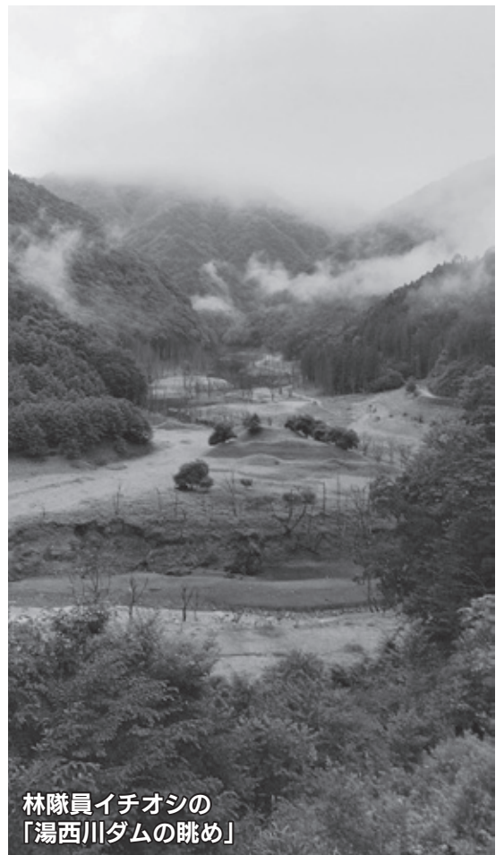
林隊員イチオシの「湯西川ダムの眺め」