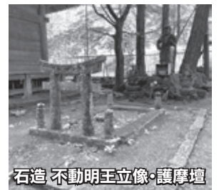
石造 不動明王立像・護摩壇

この文化財は、日光開山の祖である勝道上人が建てた四本龍寺の境内にあるんじゃ。この付近は、日光修験にとって重要な場所だったんじゃよ。護摩壇では、修験者(山伏)が不動明王に願いを叶えてもらうために、護摩を焚くんじゃ。常設の採火護摩壇は全国的に珍しく、市内には同様のものが合計3基あるんじゃよ。