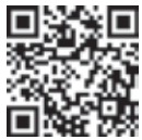
住宅用火災警報器のアンケートフォーム

このアンケートは、市内の住宅用火災警報器の設置率を調べるために実施するものです。ぜひ、皆さんの協力をお願いします。