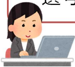
求人者マイページホーム画面（イメージ）