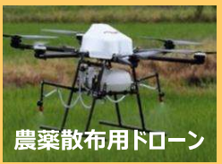
農薬散布用ドローン