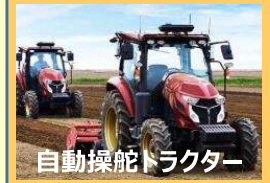
自動操舵トラクター

経営面積の拡大、低コスト化、品目転換などに取り組む際に必要となる農業用機械等の導入を支援。