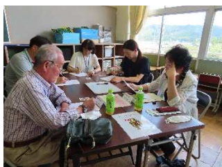
▲まずは自分で考えました