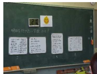
▲全体で共通点を考えました