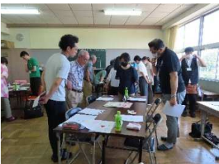
▲各グループを見て回りました