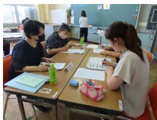
▲ミニホワイトボードにまとめました