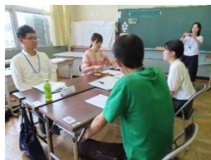
▲笑顔でよろしくお願いします

今日の目的は、仲良くなることです。仲良くなる一歩は、「笑顔」ですね。スマイルでよろしくお願いします。