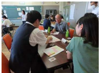
▲グループで話し合いました