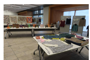
令和6年度受講生および講師の作品(作品展)