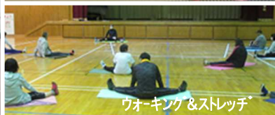
ウォーキング&ストレッチ