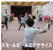
スモールホールエクササイズ