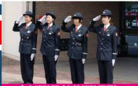
今市消防団 (女性消防団員)