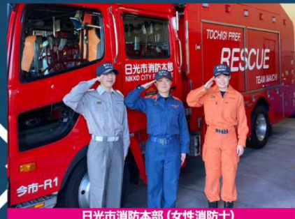
日光市消防本部 (女性消防士)