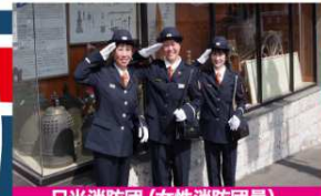
日光消防団 (女性消防団員)