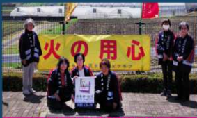
日光市女性防火クラブ