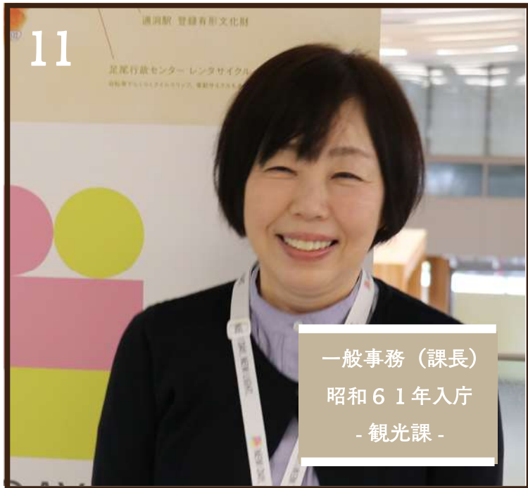
一般事務（課長） 昭和61年入庁 - 観光課 -