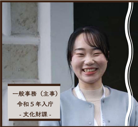
一般事務（主事） 令和5年入庁 - 文化財課 -