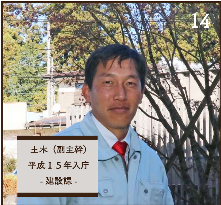
土木（副主幹） 平成15年入庁 - 建設課 -