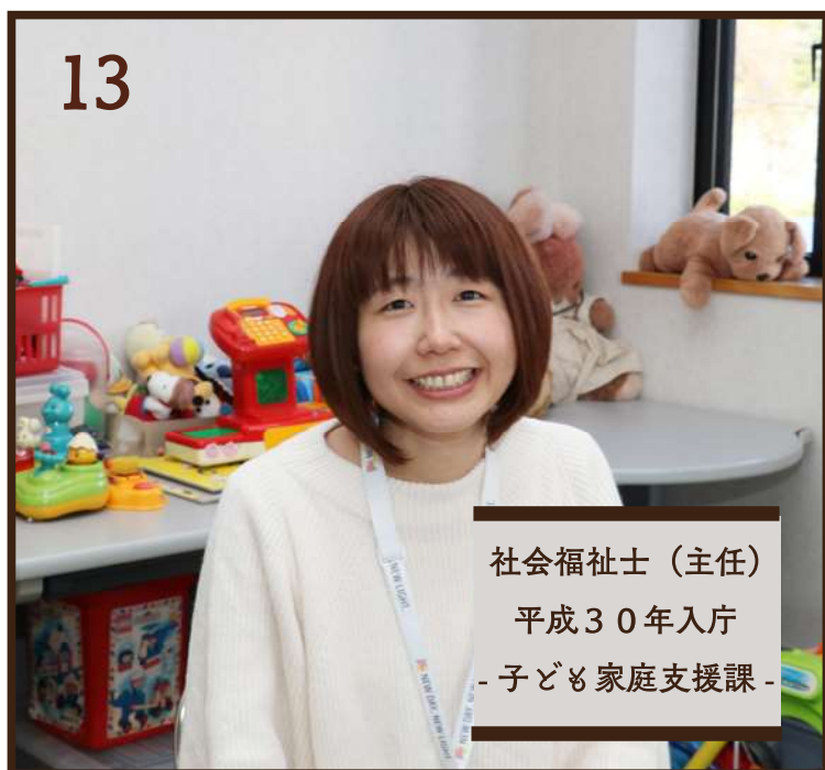
社会福祉士（主任） 平成30年入庁 - 子ども家庭支援課 -

私が所属する企画部門では新規事業を考えることもあり、自分のアイデアが市の取り組みに反映できるのは面白いです！帰宅後は好きなご飯を作り、趣味に没頭して明日への活力を回復させています。