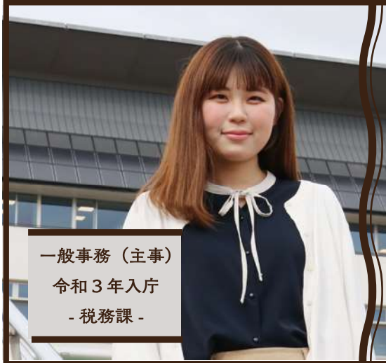
一般事務（主事） 令和3年入庁 - 税務課 -