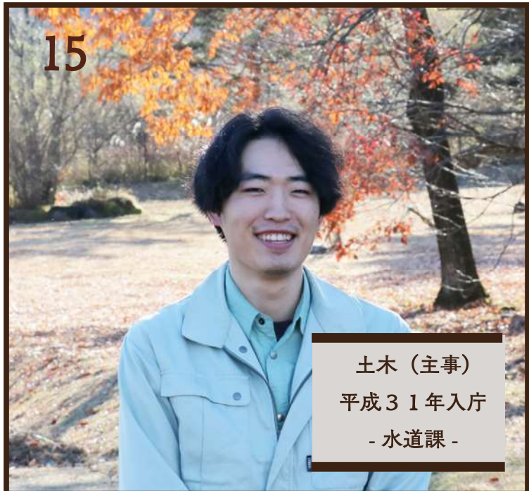
土木（主事） 平成31年入庁 - 水道課 -