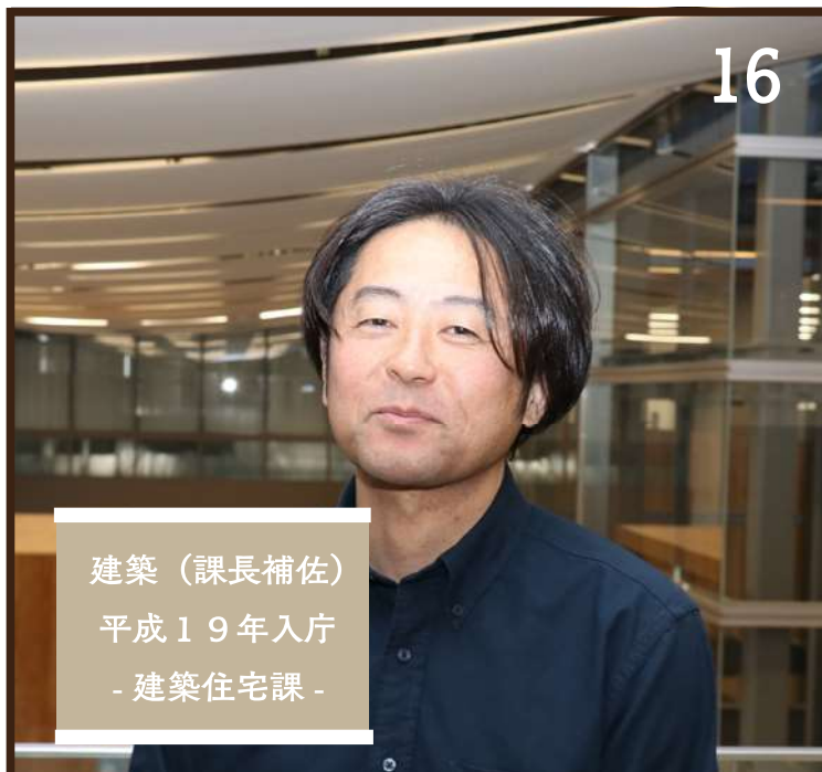
建築（課長補佐） 平成19年入庁 - 建築住宅課 -