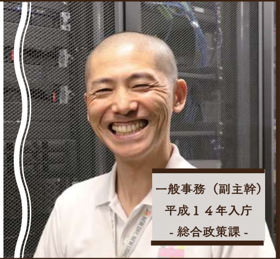
一般事務（副主幹） 平成14年入庁 - 総合政策課 -

Q1. 仕事をするときに意識していることは？ ・協力関係：仕事は単独ではなく、チームで成り立っています。まずは自分が協力的に！ ・成長意欲：自己研鑽できる環境が整っています。市町村アカデミー（詳しくは検索）の受講を希望し、3回も受講させていただきました。 Q2. 就活生に伝えたいこと 日光市役所に入庁できて本当によかった、と私は心から思っています。幾度となく、課や係関係なく、私を助けてくれる方がいました。あなたを助ける日が来ることを、また、あなたに助けてもらえる日が来ることを楽しみにしています。 平成14年4月入庁→総務課→経済課→観光農林課→行革・情報推進課→市民課→総務課→人事課→税務課→総合政策課（現職） 8 3児の父です。教育費の備えとして、1.2%利息の『共済貯金（「栃木県市町村職員共済 貯金」で検索）』とiDeCoで、資産形成しています。令和6年からは、新NISAも使っていきます。