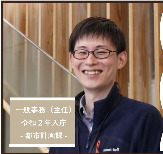
一般事務（主任） 令和2年入庁 - 都市計画課 -